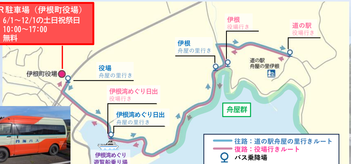
P&Rで運行する無料バス (左：6月/右：7～12月)

P & R 駐車場 (伊根町役場) 期間：6/1～12/1の土日祝祭日 時間：10:00～17:00 料金：無料