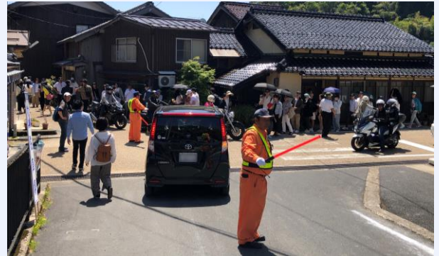
左：観光の車で渋滞する伊根浦地区の道路／右：歩行者で混雑する伊根浦地区の道路